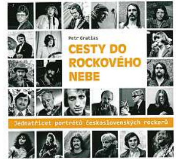
Cesty do rockového nebe Vydala Jota, cena: 448 Kč.

Přednostmi knihy jsou grafická úprava, abecední řazení portrétů a vybraná píseň i s kytarovými akordy u každého z hudebníků.