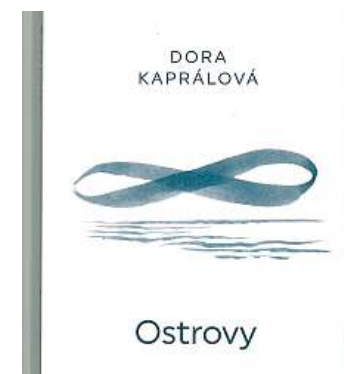
Ostrovy Vydalo nakladatelství Druhé město, cena: 260 Kč.