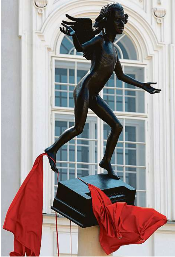
Malý Mozart Jednou ze soch, které se věnuje jejich průvodce Brnem, je jedenáctiletý Wolfgang Amadeus Mozart na Zelném trhu.

Kniha, jejímž hlavním autorem je Radek Horáček, kromě čtivého textu nabízí na 224 stranách 123 barevných fotografií 98 děl včetně 93 medailonů sochařek a sochařů.