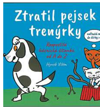
Ztratil pejsk trenýrky Vydalo Books & Pipes Publishing, cena: 245 Kč.

Verše navazují na bohatou tradici české nonsensové poezie, zde jednoznačně určené současným dětem, neboť tu básník rýmuje i se slovem Facebook, chat či aktualizovanými názvy obchodních řetězců. A mohou posloužit třeba i k procvičování výslovnosti.