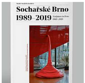
Sochařské Brno 1989-2019 Vydala Masarykova univerzita se spolkem CooperARTive, cena: 330 Kč.

Hledáte nové bydlení? Tisíce nabídek nemovitostí na jednom místě.